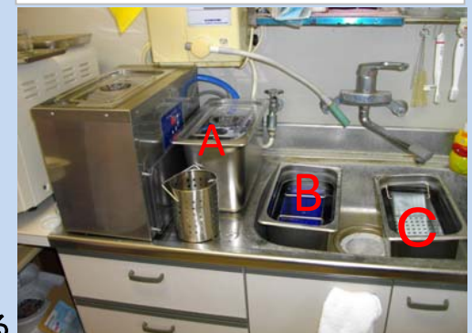
歯科医院様の設置(例1)

バスケットと洗浄タンクを各3ヶ準備され洗浄サイクルをスムーズに行っております。Cは流水下で濯ぐために使用しております。流れを一層スムーズにするためにバスケットも1ヶ多めに準備されました。